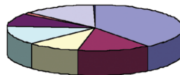
Causes de mortalité chez les oiseaux

De plus, lors de l'étude environnementale, la communauté aura la possibilité de s'exprimer et de faire part de ses préoccupations et des enjeux qu'elle juge importants. La société Kruger consultera la population et prendra en considération ses inquiétudes et ses priorités dans le développement du projet éolien.